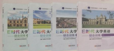
《E时代大学英语——综合训练》1~4册