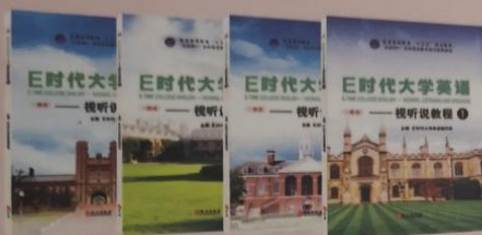
《E时代大学英语——视听说教程》1~4册