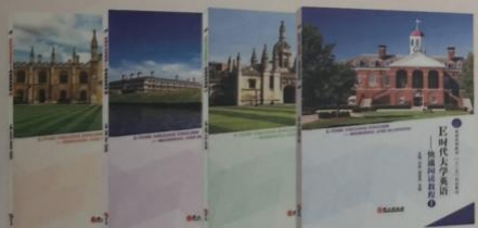
《E时代大学英语——快速阅读教程》1~4册