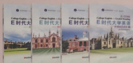
《E时代大学英语——阶梯阅读教程》1~4册