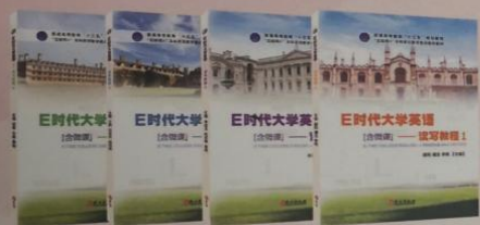
《E时代大学英语——读写教程》1~4册